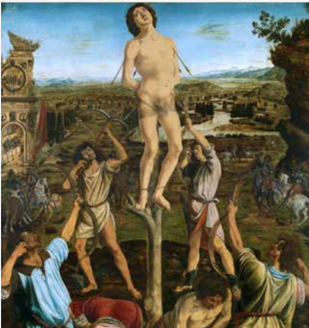
تصویر ۸. بالا: شنونده، جف وال، ۲۰۱۵. خوشنویسی که در این عکس دیده می‌شود، کاملاً طبیعی و در عین حال ساختگی است. وال، ماه‌ها برای مطالعه این موضوع که چگونه هنرمندان و رسانه‌ها (روزنامه، تلویزیون، اینترنت و...) لحظه‌های خشن را بازنمایی می‌کنند، وقت گذاشت و مشخصه‌های رایج این ناهنجاری‌ها را درون ترکیب‌بندی عکسش گنجانده. این شمایل‌سازی بسیار به شمایل‌نگاری‌های مسیح مصلوب وام‌دار است؛ بدن رنجور در میان مردم پستی که اطرافش را احاطه کرده‌اند در زمینی نامعلوم، البته در شما و شکلی مدرن و عکاسانه! پایین: شهادت سن سباستین، آنتونیو پولاویوتولو، حدود ۱۴۷۵ میلادی.

سلف‌پرتره‌های شرم‌ن، شکل کریستال‌گون تیپ‌های فرهنگی است و به واسطه حضور عکاس در داخل قاب (عنصری که عموماً در پشت دوربین به شکل‌دهی و ساخت قاب عکس و در نتیجه فرایند معنادهی و قضاوت مشغول است)، عامل «عکاس» را به مثابه شمایل در مرکزیت معنای عکس قرار می‌دهد. او «با این کار، بیننده را با آمیزه‌ای از اسطوره‌های فرهنگی مواجه می‌کند که در عین غرابت با نگاه امروزی، مجدداً ما را با قدرت تصاویر مدفون در گذشته‌ی مشترکمان آشنا می‌سازد» (همان: ۱۶۲) و در عین حال، به توانایی خود به عنوان زن، در