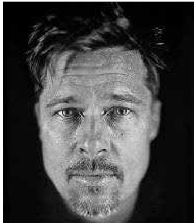
تصویر ۹. برد بیت، چاک کلوز؛ داگرتوتیپ، ۲۰۰۹.