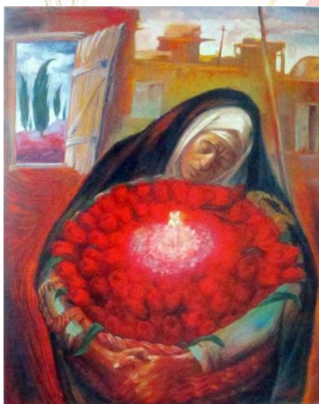
تصویر ۳- معراج شهید. محمدعلی رجبی

تزیینی (تصویر ۳) و... همگی برگرفته از عناصر نقاشی ایرانی با مفهوم نمادین نویی منطبق با مبادی هنرهای تجسمی ارائه شده‌اند (خزائی، ۱۳۹۲: ۲).